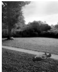
Signe Vad: Leveling of Deviances , 2008. Foto