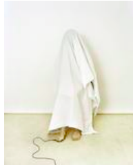
Signe Vad: The Decisive Moment V , 2008. Foto