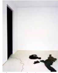
Signe Vad: The Decisive Moment VI , 2008. Foto