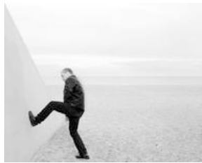
Signe Vad: Terminal Instability , 2008. Foto

Titlen på udstillingen er Positions of Infinity . Hvordan kom du frem til den?