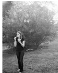
Signe Vad: Seedy Contemplation , 2008. Foto