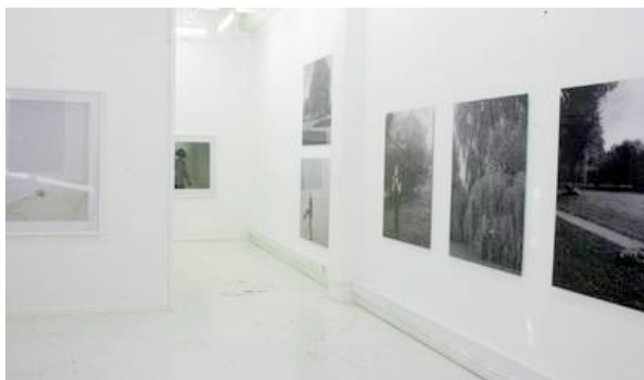
Signe Vad: Positions of Infinity , installationsview.

Signe Vad Positions of Infinity 15. januar - 21. februar 2009 Peter Lav Gallery Bredgade 25F, 1.sal Skt. Annæ Passage, 1260 København K web site: www.plgallery.dk Tirsdag-fredag 12-17, lørdag 12-15